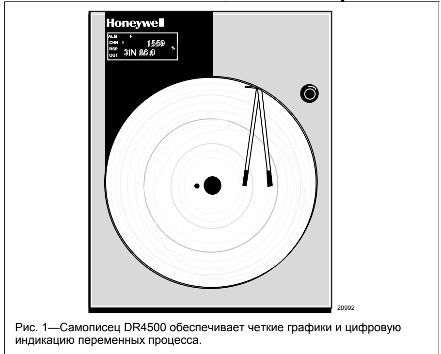
Рис. 1—Самописец DR4500 обеспечивает четкие графики и цифровую индикацию переменных процесса.